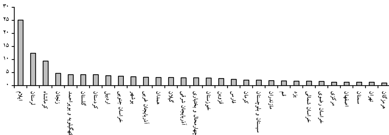
نمودار ۳- ترتیب استانی مرگ‌های مشکوک به خودکشی زنان بر حسب جمعیت (به ازای هر صد هزار زن) در سال ۲۰۱۰