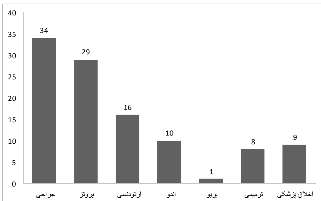
نمودار ۱ - تعداد و درصد شکایت علیه دندانپزشکان شیراز به تفکیک رشته در سال های ۹۰-۱۳۸۵ (تعداد = )