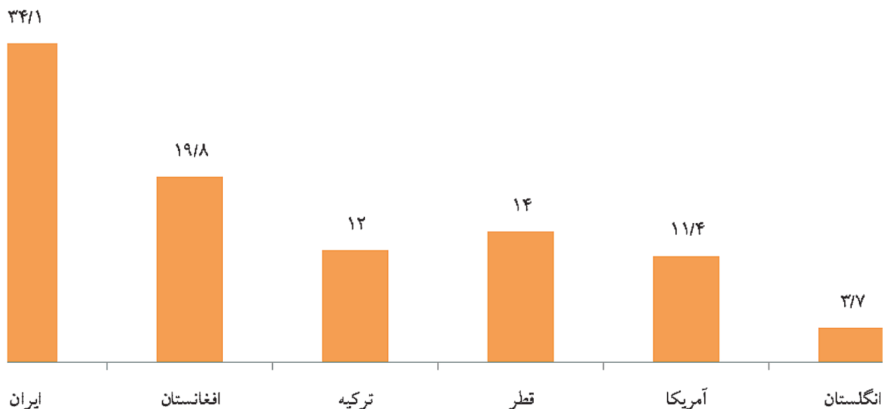
نمودار ۱: مقایسه میزان مرگ و میر ناشی از حوادث رانندگی در ایران و چند کشور (۲۰۱۰)

نمودار شماره ۱ نشان می‌دهد، میزان مرگ و میر ناشی از سوانح ترافیکی در یک صد هزار نفر جمعیت در کشورمان از تمامی کشورهای همسایه بیشتر است. این اختلاف با کشورهای توسعه یافته بسیار بیشتر می‌باشد (۶).